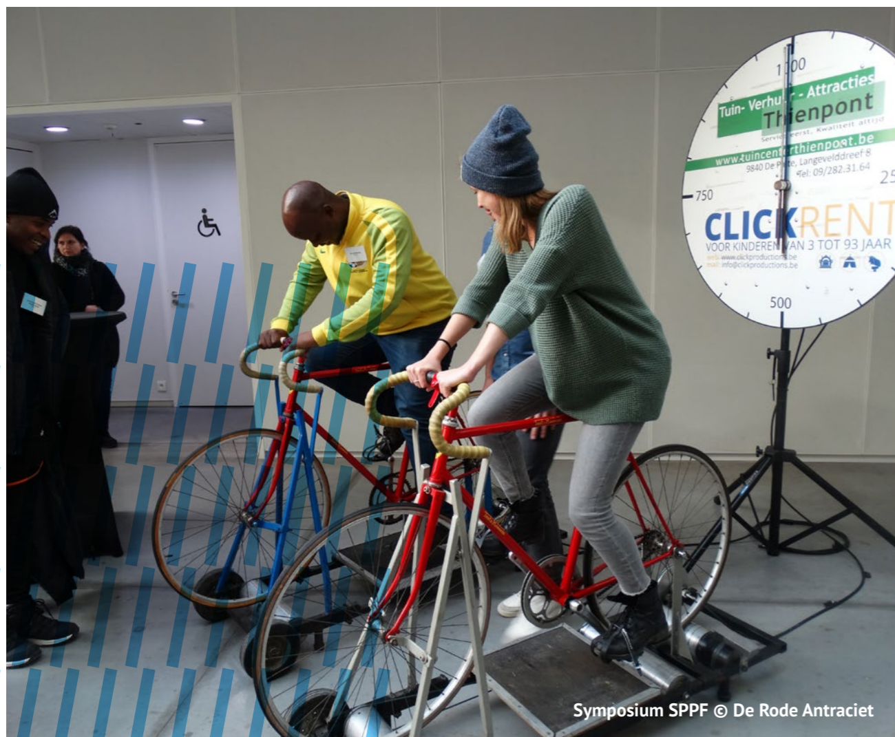
Symposium SPPF

Gino: Mensen hebben vaak een verkeerd beeld van zo'n buitenlandse ontmoetingen, want dat is eigenlijk vooral heel hard werken. En na die twee of drie dagen ben je ook echt kapot. Er passeert heel veel op korte tijd en partners grijpen zo'n gelegenheid aan om hun bekommernissen te delen, terwijl wij als trekkers vooral verder willen.