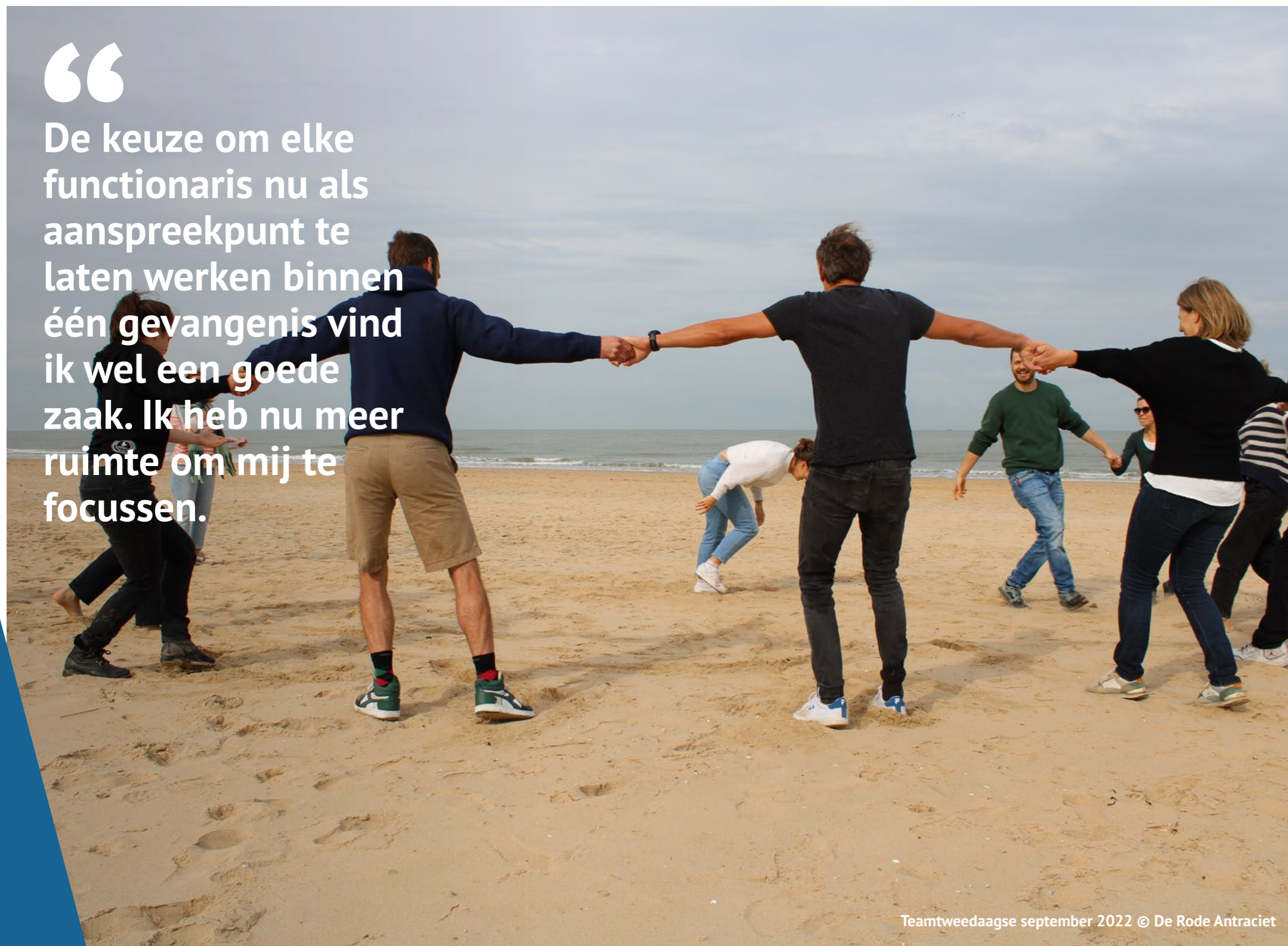
Teamtweedaagse september 2022

De keuze om elke functionaris nu als aanspreekpunt te laten werken binnen één gevangenis vind ik wel een goede zaak. Ik heb nu meer ruimte om mij te focussen.