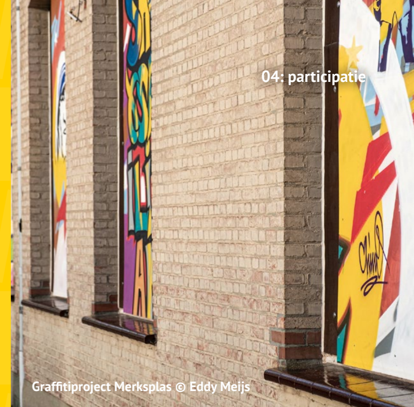
Graffiti project Merksplas

“Wat de deelnemers zelf betreft, ik hoop dat ze meer zelfvertrouwen hebben gekregen en dat ze positieve dingen kunnen bereiken.”