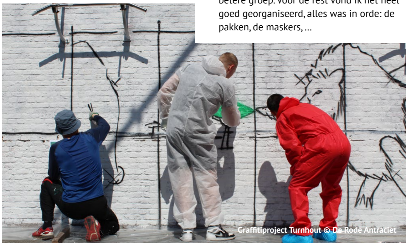
Graffiti project Turnhout